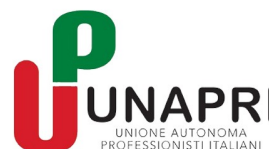
UNAPRI UNIONE AUTONOMA PROFESSIONISTI ITALIANI